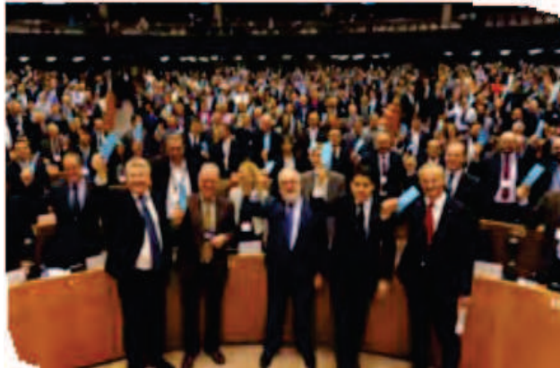
Os líderes e alcaldes da UE apoian de forma simbólica o Pacto dos alcaldes para o clima e a enerxía no Parlamento Europeo en 2015.

Comisario Europeo de Acción polo Clima e a Enerxía